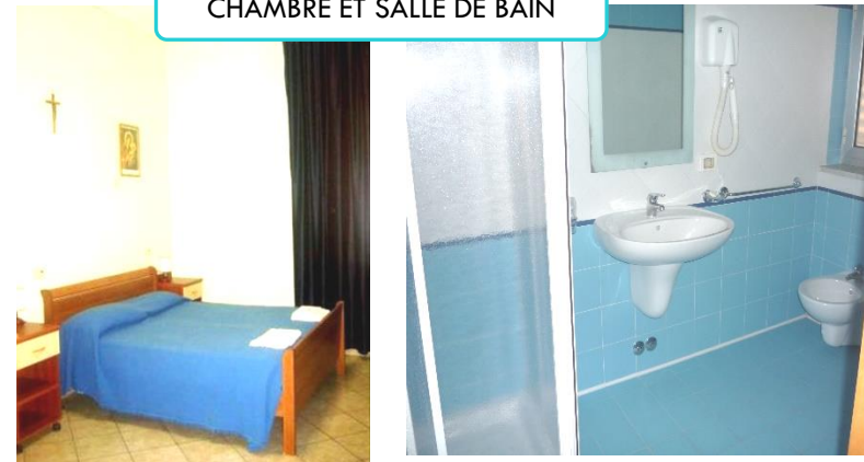
CHAMBRE ET SALLE DE BAIN

La maison est entièrement équipée pour le confort des personnes handicapées. Une chapelle est également à disposition pour les groupes de pèlerins.